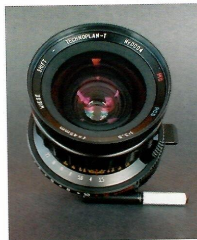
Technoplan - T (Tilt)

bardziej wygodne w obsłudze, choć skomplikowane w konstrukcji rozwiązanie. "Shiftowanie" możliwe jest poruszaniem pierścienia wbudowanego pod bagnetem obiektywu. Stopka zamocowana przy pierścieniu umożliwia obracanie obiektywem dookoła jego osi. 12mm przesuwu w dowolnym kierunku przy ogniskowej 45mm to marzenie każdego fotografa.