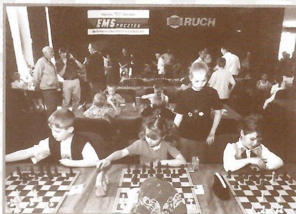
MISTRZOSTWA PRZEDSZKOLAKÓW ROZEGRANE W RAMACH FESTIWALU