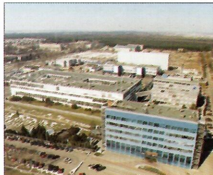
Fabryka w Poznaniu

Praktyki Wytwarzania, zdolnym dostarczać wysokiej jakości leki pacjentom w całej Europie.