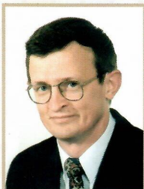
Tadeusz Cymański Poseł na Sejm RP