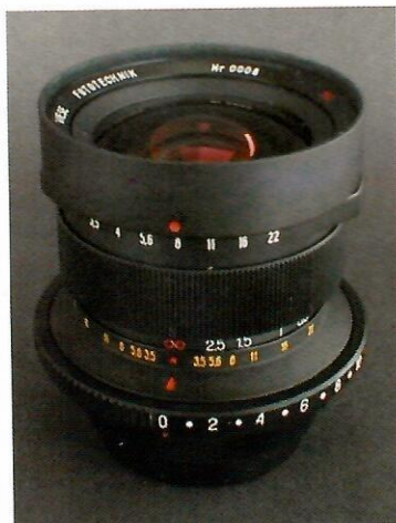
Shift MC 3,5/45 mm

2 lata trwały przygotowania do produkcji tego skomplikowanego w budowie obiektywu. Obiektywy tego typu wyposażone są często w zamocowaną na boku obiektywu śrubę, która umożliwia jego przesuw w pionie lub poziomie. W obiektywie Technoplan zastosowaliśmy