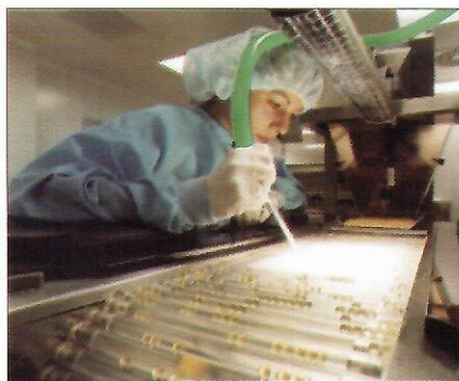
Wydział Kapsulek Miękkich

Dzięki znacznym nakładom fabryka w Poznaniu stała się jednym z najnowocześniejszych zakładów w Polsce, spełniającym standardy Dobrej